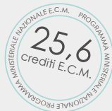
Foto e video nella pratica clinica

La fotografia medico/scientifica nasce come esclusivo strumento di condivisione e comunicazione in ambito medico.