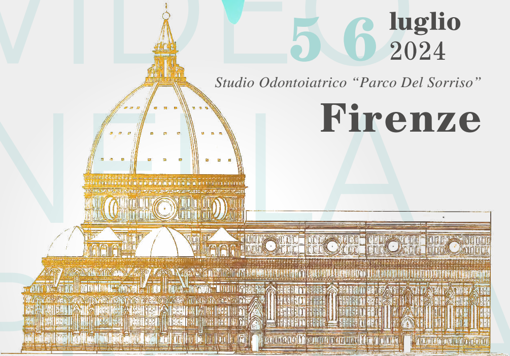
FOTO E VIDEO NELLA PRATICA CLINICA