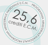
FOTO E VIDEO NELLA PRATICA CLINICA